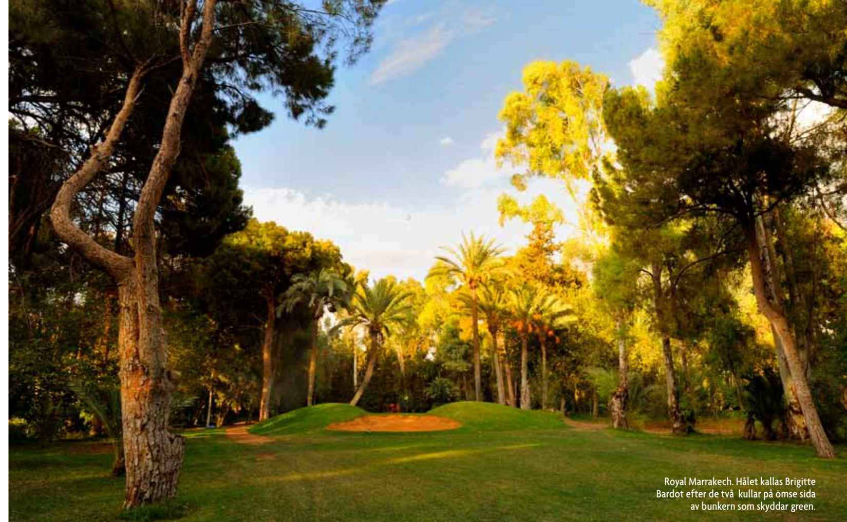
Royal Marrakech. Hålet kallas Brigitte Bardot efter de två kullar på ömse sida av bunkern som skyddar green.