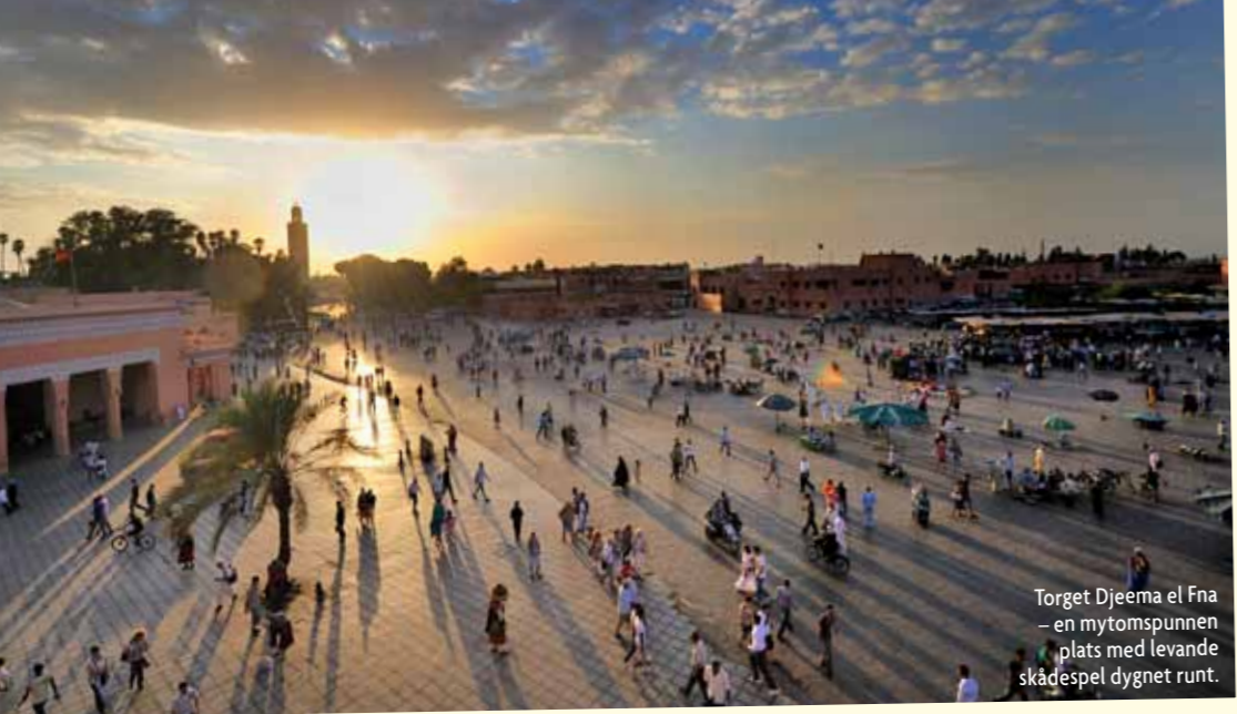
Torget Djeema el Fna – en mytomspunnen plats med levande skådespel dygnet runt.