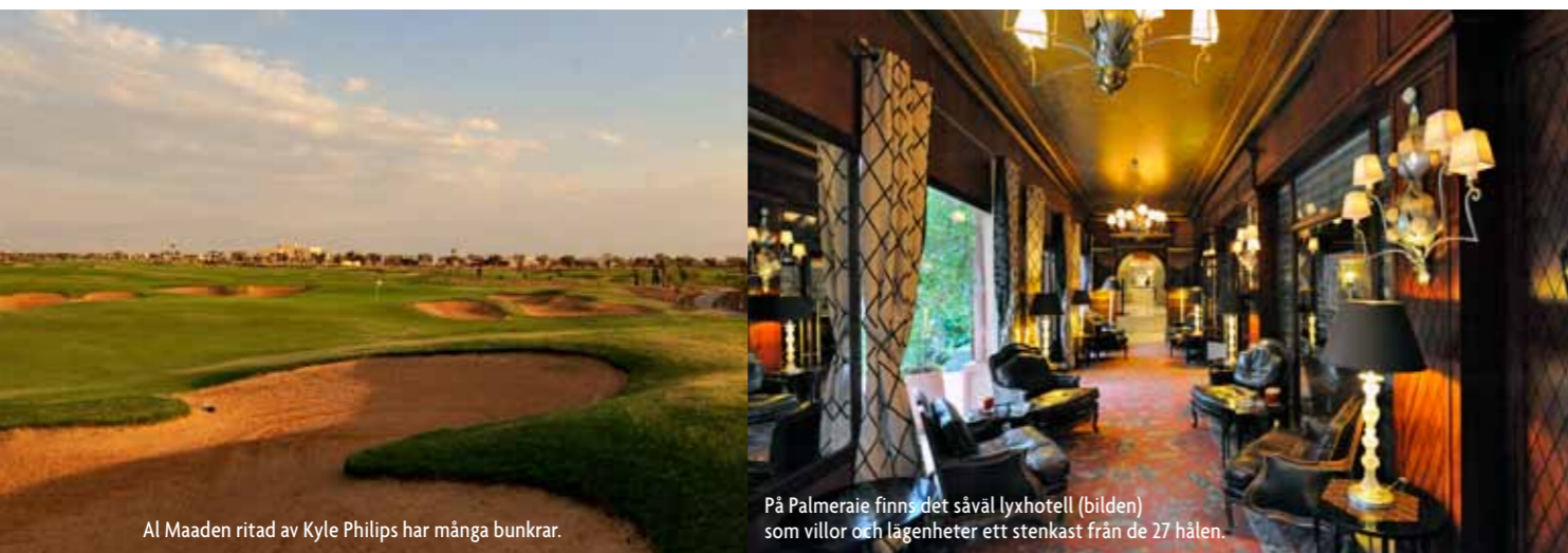
Al Maaden ritad av Kyle Philips har många bunkrar.