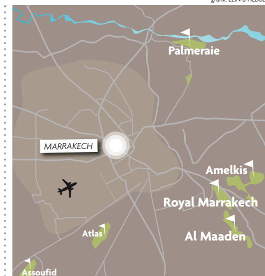
grafik: ELIN B HEDBERG

Klassiska rätter från det marockanska köket är